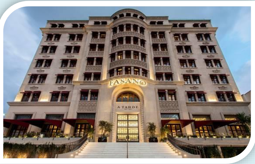
Unidade Hotel Fasano – Salvador