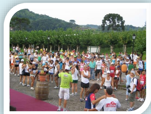
Foto: Corredores em aquecimento em meio aos parreirais.