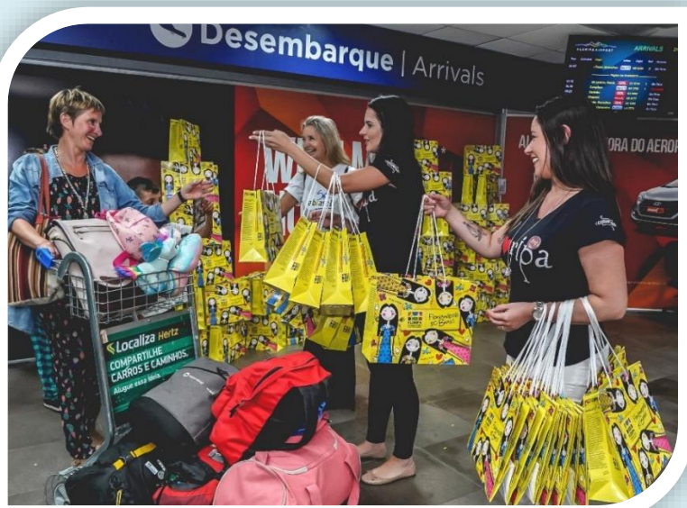
Floripa Convention participa de recepção de turistas estrangeiros

Durante os meses de janeiro e fevereiro foram realizados 50 voos fretados com o objetivo de estimular o turista internacional a visitar o destino. Semanalmente a Decolar disponibilizou 5 voos vindos da Argentina e 2 voos vindos do Chile. Um dos resultados da ação para a economia da cidade foi a geração de cerca de 60 mil pernites.