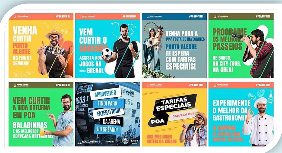
Peças da Campanha

Criada pela entidade para comunicar as tarifas promocionais da rede hoteleira nos finais de semana (período com redução de demanda), a campanha teve como conceito básico mostrar aos visitantes de Porto Alegre as vantagens de estar na cidade na sexta-feira, sábado e domingo, aproveitando não só as vantagens de uma tarifa especial de hospedagem, mas também os inúmeros atrativos que a cidade oferece.