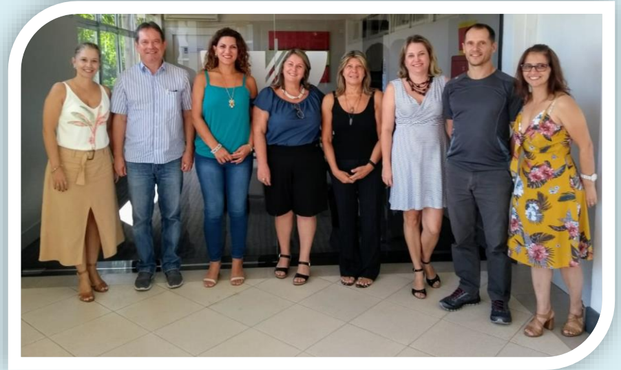
Diretoria do Visite Itajaí C&VB e Coordenação da UNIVALI

Desde 08 de fevereiro, integrantes do Visite Itajaí C&VB estão se reunindo com as coordenações da UNIVALI - Universidade do Vale do Itajaí, juntamente com o apoio da Secretaria Municipal de Turismo de Itajaí, para alinhar as diretrizes do projeto que envolverá o setor de alimentos e bebidas da cidade. O evento deverá ocorrer no mês de agosto, e diferente dos outros formatos, essa edição a proposta é fazer uma harmonização entre os pratos e as cervejas e vinho local. Além da harmonização, trazer uma releitura de pratos típicos será o grande desafio proposto aos proprietários de restaurantes, bares e similares.