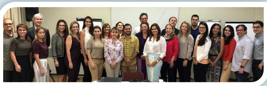
Participantes do Planejamento Estratégico do Visite Ceará