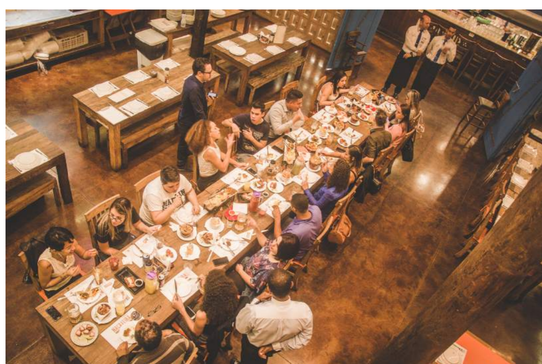
Recepcionistas dos Hotéis de Guarulhos

Além de mostrar a diversidade gastronômica e oferta de produtos para todo tipo de público (casais, família, amigos, jovens...) os recepcionistas puderam conhecer o atendimento e as boas instalações para indicação assertiva aos turistas. Foram visitados os locais: Macaxeira, Vila Velha, The Fire Steakhouse, Adega 33 e Izumi Suhi. Varandas Esperto Bar, Beco da Vila, Marechal Choperia & Botequim, Boteco Boa Vista e Eleven. Participaram os recepcionistas dos hotéis: Mercure, Pullman, Marriott, Slaviero, Sleep INN, TRYP by Wyndham, Hotel Matiz e Sables Hotel.