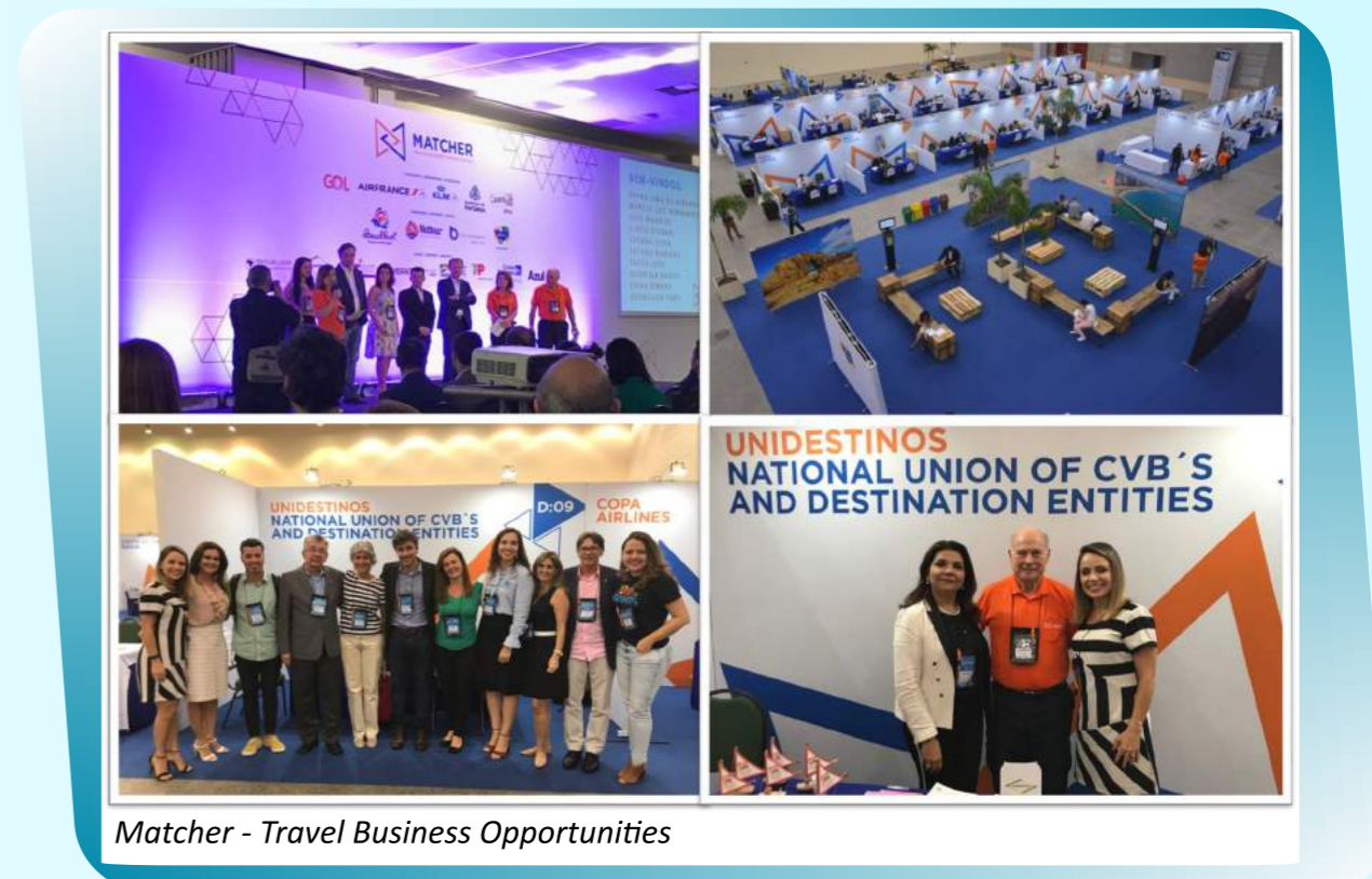
Matcher - Travel Business Opportunities

2020 será nos dias 11 e 12 de maio em Fortaleza.