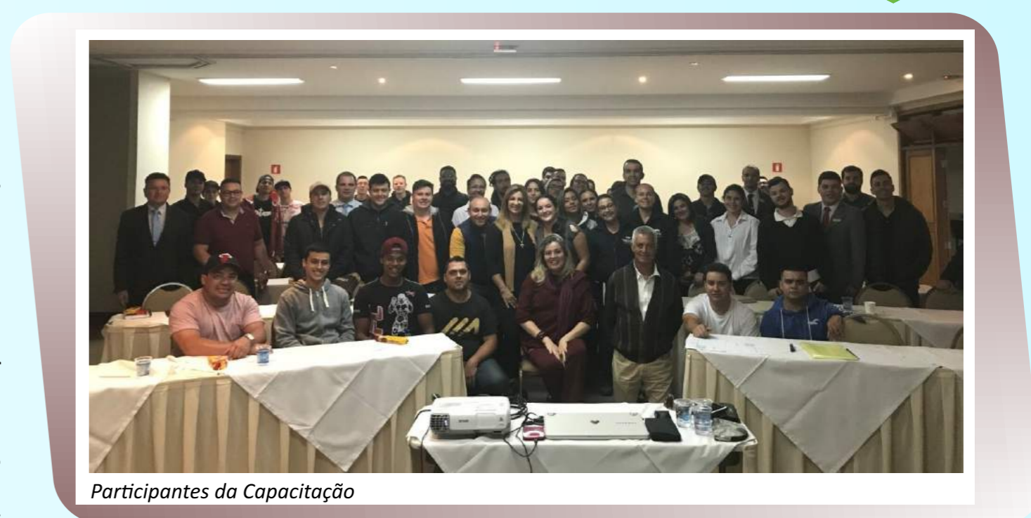
Participantes da Capacitação

Foram dias de muito aprendizado e desenvolvimento contínuo a favor do turismo de Campos do Jordão.