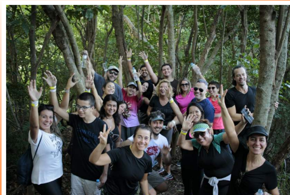
Ação Bleisure - ACTE 2019

No dia 10 de junho de 2019, aconteceu no Rio de Janeiro, o ACTE Summit Rio, com o apoio do Rio Convention & Visitors Bureau. Esse ano, o evento contou com uma ação especial: o Bleisure. Realizado no domingo, dia 09, no Parque da Catacumba, os participantes puderam realizar atividades como trekking, arborismo e tirolesa em um dia relaxante, pré evento. O conceito Bleisure está ligado a viagens corporativas ou de negócios, aliadas ao lazer (B de Business + Leisure). É a possibilidade do viajante adicionar lazer à sua viagem corporativa, possibilitando conhecer a cidade, sua cultura e costumes.