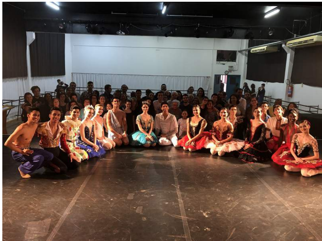
1º Grupo da CVC e bailarinos da Cia. Jovem da Escola do Teatro Bolshoi, na primeira edição do "Bolshoi Brasil Experience" em Joinville (SC).