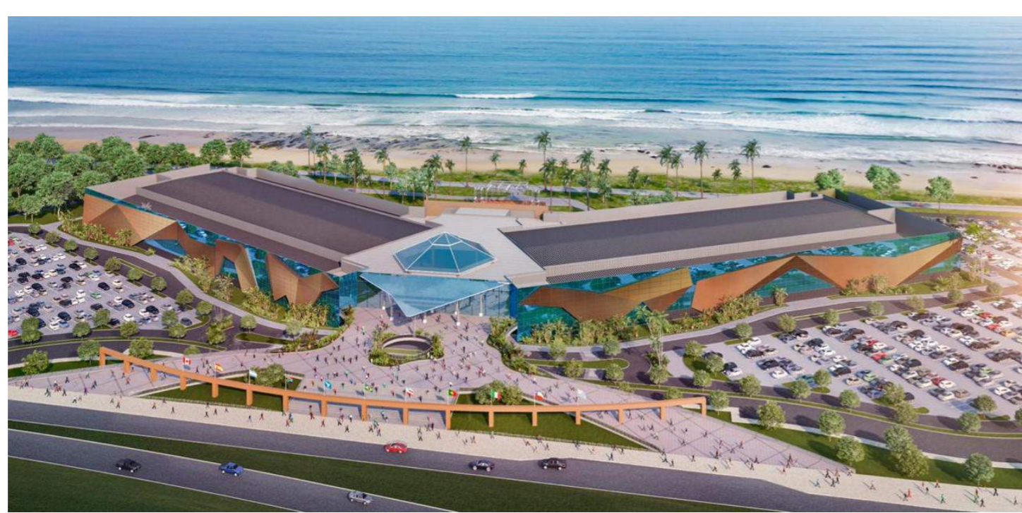
Maquete - Projeto do Centro de Convenções de Salvador - BA