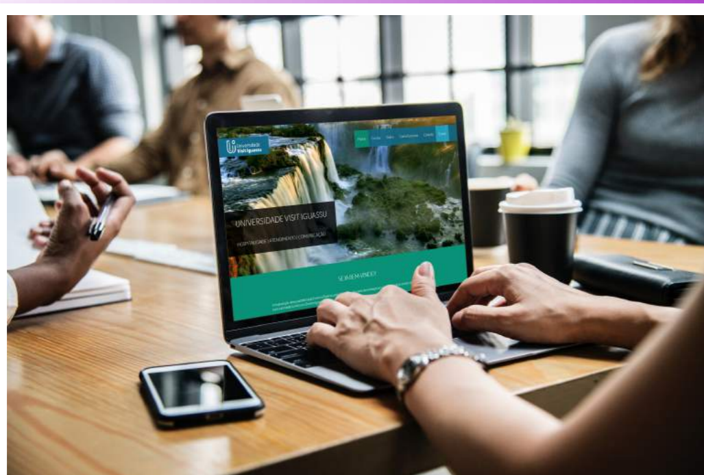
Plataforma EAD Universidade Visit Iguassu