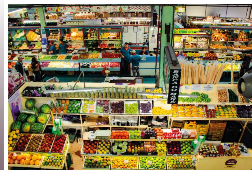
Sabores do Mercado

O evento é viabilizado pela Lei Municipal de Incentivo à Cultura, com incentivo das empresas Palace Hotel e Instituto Donato de Oftalmologia e tem o apoio do Poços CVB, Associação de Bares e Restaurantes e do Condomínio do Mercado Municipal.