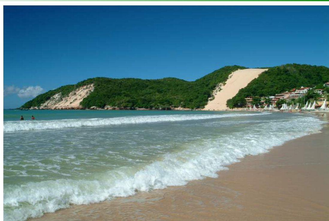
Praia Ponta Negra - Natal - RN