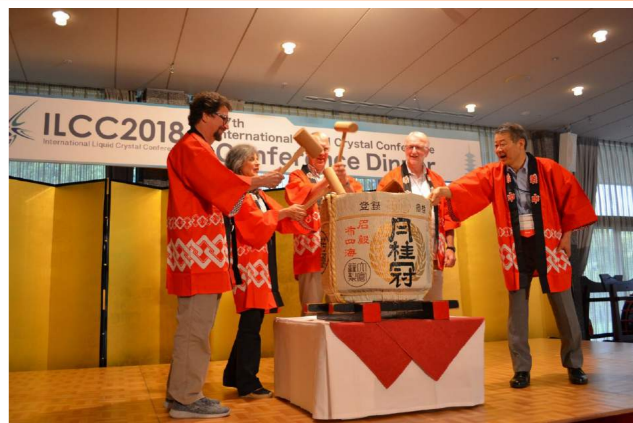
Edição da conferência no Japão