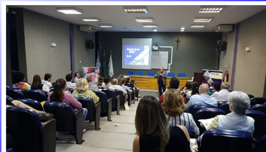
Apresentação do Projeto de Captação de Eventos / Sensações aos diretores de Centro e Departamento da Universidade Federal do Espírito Santo

Uma parceria entre Espírito Santo Convention & Visitors Bureau, Pró-Reitoria de Extensão da Ufes (Universidade Federal do ES) e Ifes-ES promete dar um up na captação de eventos técnicos e científicos para o ES. Dentro do projeto Captação de Eventos e Sensações Capixabas, que tem apoio da Setur, o Convention já percorreu os campi de Vitória, Alegre e São Mateus para sensibilizar coordenadores e professores das instituições de ensino quanto a importância de indicarem eventos para a prospecção. O resultado já é positivo: nestes primeiros contatos dez congressos foram apontados.