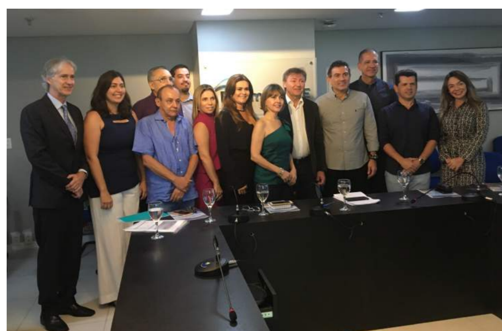
Apresentação da Pesquisa para Cadeia Produtiva de Eventos e Imprensa

Em abril desse ano foi apresentado o resultado da Pesquisa de Impacto Econômico do Turismo de Eventos Realizados em Fortaleza no ano de 2018, com a parceria exitosa do Visite Ceará, Fecomércio-CE e Unifor. Foram pesquisados 26 eventos com 23.712 participantes e 3.308 questionários respondidos, abrangendo congressos, eventos esportivos e feiras. Além da hotelaria, que representa 38,5% dos gastos do nosso visitante, o participante gasta com alimentação 17,9%, compras 17,6%, transporte 13,1% e diversão 12,9%. À partir desses números podemos analisar que Fortaleza obteve um notável crescimento na realização de eventos, sendo um dos principais centros de negócios do País, gerando desenvolvimento econômico e preenchendo os vazios de sazonalidade turística.