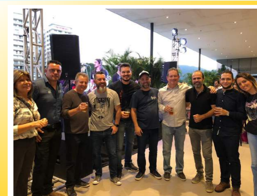
Festival Brava Beer

Os amantes de uma boa cerveja artesanal ou mesmo os curiosos por sabores e ingredientes diferentes puderam nos dias 21, 22 e 23 de junho, prestigiar o 1º Festival Brava Beer, um evento que uniu à cultura cervejeira com muito blues e rock n'roll. O Brava Beer foi o primeiro evento oficial do Visite Itajaí Convention & Visitors Bureau que buscou oportunizar, envolver e fortalecer os membros associados ao Convention. O público presente somou pouco mais de 3mil pessoas. O Convention já se organiza para a segunda edição do evento no ano de 2020.