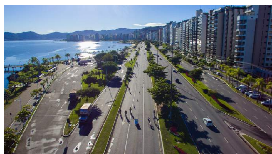
Beira Mar Norte - Créditos: Leonardo Souza