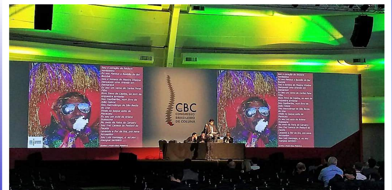
Defesa Congresso Brasileiro de Coluna 2023 - Recife