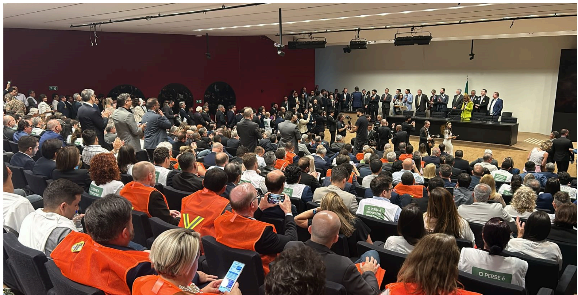
1º ATO DE MOBILIZAÇÃO EM DEFESA AO PERSE EM BRASÍLIA COM A PARTICIPAÇÃO ATIVA DAS ORGANIZAÇÕES DE VISITORS E CONVENTIONS BUREAUS