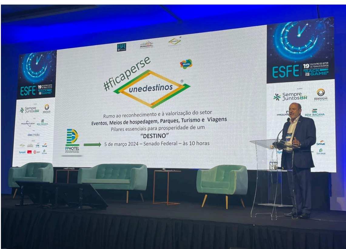
UNEDESTINOS MARCA PRESENÇA NO ESFE - ENCONTRO DO SETOR DE FEIRAS