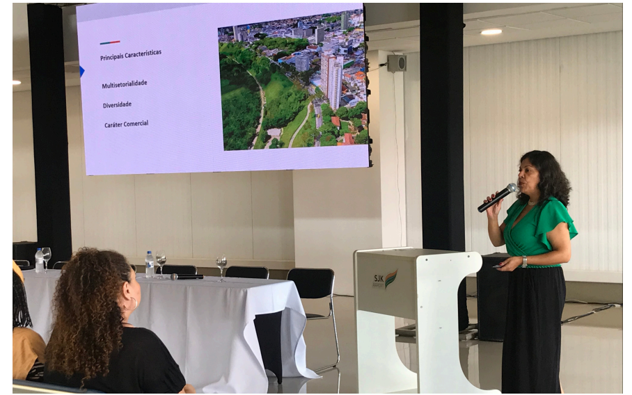
UNEDESTINOS MARCA PRESENÇA NO EVENTO DE INAUGURAÇÃO DOS VOOS DA GOL NO AEROPORTO DE SÃO JOSÉ DOS CAMPOS