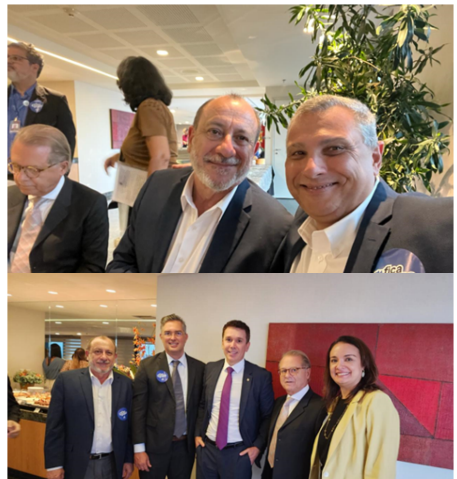
CETUR REÚNE ENTIDADES ASSOCIADAS PARA DEBATER ESTRATÉGIAS PELA MANUTENÇÃO DO PERSE